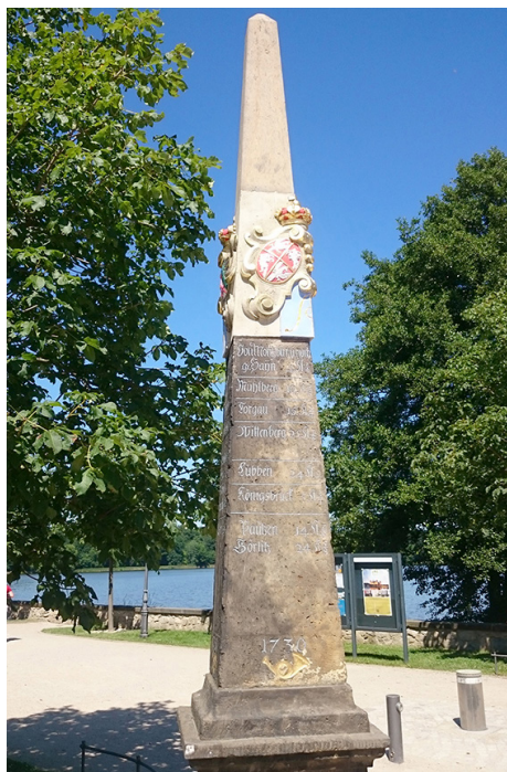
Stúp dystansowy poczty polsko-saskiej z 1730 r. w Moritzburgu