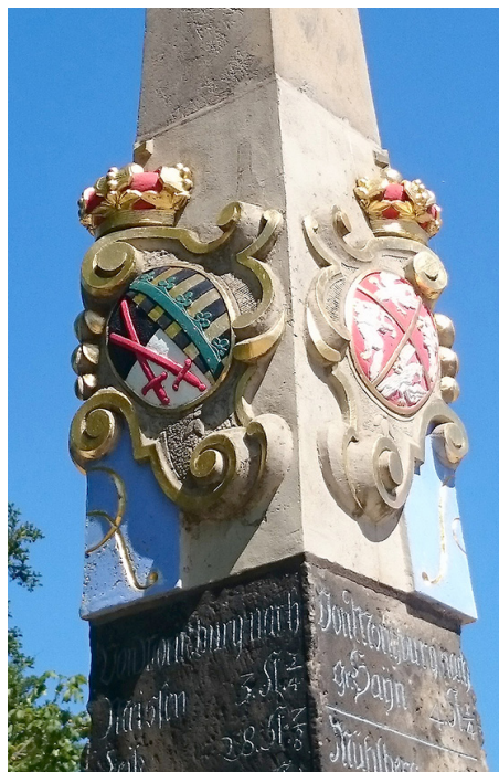
Fragment stupa dystansowego z herbami Saksonii i Rzeczypospolitej w Moritzburgu